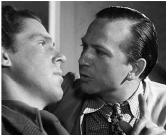
1950 VERS LA JOIE (Till Glädje) d'Ingmar Bergman avec Stig Olin