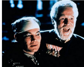
1987 HANUSSEN (Hanussen) d'Istvan Szabo avec Klaus-Maria Brandauer