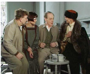
1997 EN PRÉSENCE D'UN CLOWN (Larmar och gör sig till) d'I. Bergman avec B. Ahlstedt, M. Richardson