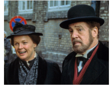
1992 SOPHIE (Sofie) de Liv Ullmann avec Ghita Nørby