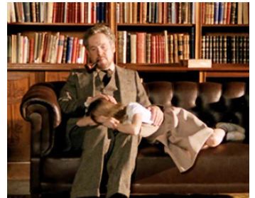
1978 SONATE D'AUTOMNE (Höstsonaten) d'Ingmar Bergman avec Lena Nyman