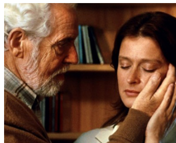
2000 INFIDÈLE (Trolösa) de Liv Ullmann avec Lena Endre