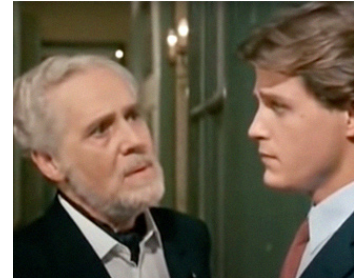
1989 LE SOLEIL NOIR (Il sole buio) de Damiano Damiani avec Michael Paré