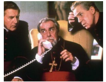
1985 SA SAINTETÉ A DISPARU (Saving Grace) de Robert M. Young avec Fernando Rey