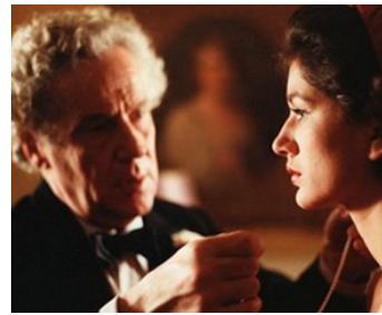
1984 DE FLYVENDE DJÆVLE d'Anders Refn avec Karmen Atlas