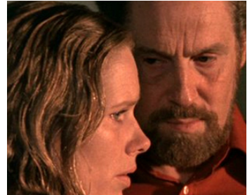
1976 FACE À FACE (Ansikte mot ansikte) d'Ingmar Bergman avec Liv Ullmann