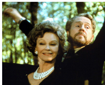
1979 OUBLIER VENISE (Dimenticare Venezia) de Franco Brusati avec Hella Petri