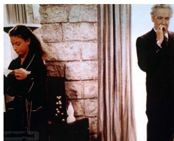
1982 LA MAISON AU TAPIS JAUNE (La Casa del tappeto giallo) de C. Lizzani avec B. Romand