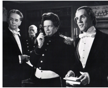
1958 LE VISAGE (Ansiktet) d'Ingmar Bergman avec Gunnar Björnstrand, Toivo Pawlo