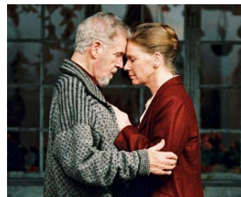
2003 SARABANDE (Saraband) d'Ingmar Bergman avec Liv Ullmann