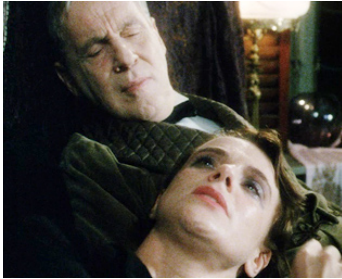
1985 AMOROSA (Amorosa) de Mai Zetterling avec Stina Ekblad