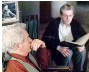
1994 LE FRUIT INTERDIT (Zabraneniat plod) de Krassimir Kroumov avec Samuel Finzi