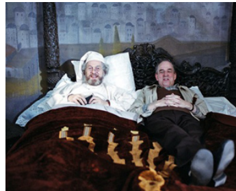
1977 UN ET UN (En och en) d'Erlend Josephson avec Ingmar Bergman