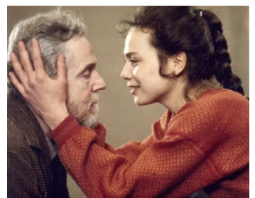
1983 APRÈS LA RÉPÉTITION (Efter repetitionen) d'Ingmar Bergman avec Lena Olin