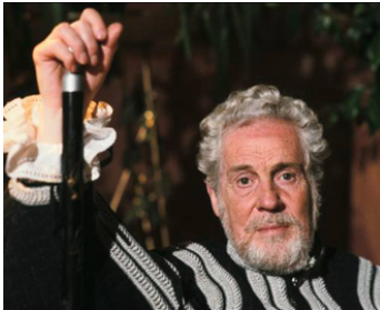
1990 LE LIVRE DE PROSPERO (Prospero's Book) de Peter Greenaway