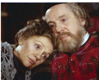
1982 FANNY ET ALEXANDRE (Fanny och Alexander) d'Ingmar Bergman avec Gunn Wallgren