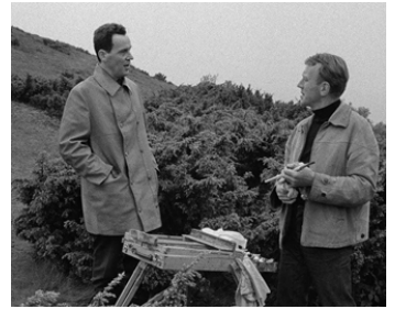
1966 L'HEURE DU LOUP (Vargtimmen) d'Ingmar Bergman avec Max von Sydow