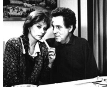
1988 UNE FEMME BRISÉE (Una Donna spezzata) de Marco Leto avec Lea Massari