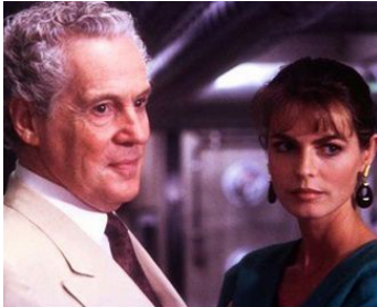
1986 CONTRÔLE (Il Giorno prima) de Giuliano Montaldo avec Cyrielle Clair