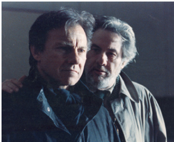
1993 LE REGARD D'ULYSSE (To vlemma tou Odyssea) de Theo Angelopoulos avec H. Keitel