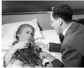
1958 AU SEUIL DE LA VIE (Nära livet) d'Ingmar Bergman avec Ingrid Thulin