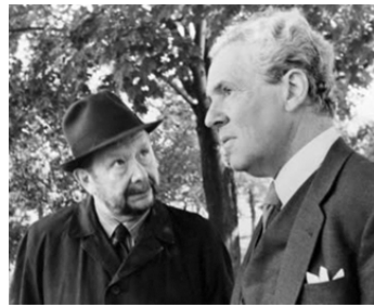
1984 UNE SALLE HISTOIRE (Dirty Story) de Jörn Donner avec Nils Brandt