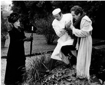
1976 AU-DELÀ DU BIEN ET DU MAL (Al di là del bene e del male) de L. Cavani avec Véra Lisi