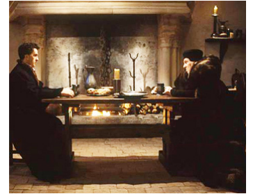
1986 LE MAL D'AIMER (La Coda del Diavolo) de Giorgio Treves avec Robin Renucci