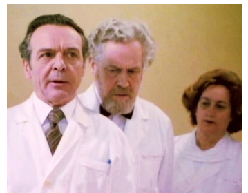
1981 VARIOLA VERA (Variola Vera) de Goran Markovic avec Rade Serbedzija