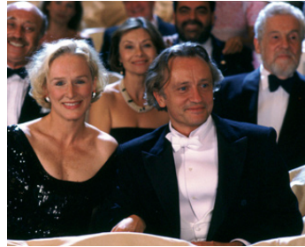
1990 LA TENTATION DE VÉNUS (Meeting Venus) d'Istvan Szabo avec G. Close, Niels Arestrup