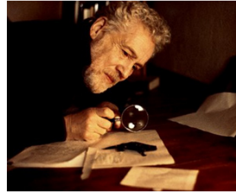
192 HOLOZAN (Holožän) d'Heinz Büttler & Manfred Eicher