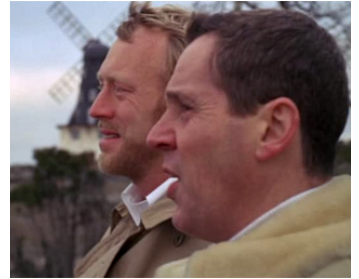
1969 UNE PASSION (En Passion) d'Ingmar Bergman avec Max von Sydow