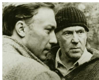
1983 NOSTALGIA (Nostalgia) d'Andrei Tarkovsky avec Oleg Yankovski