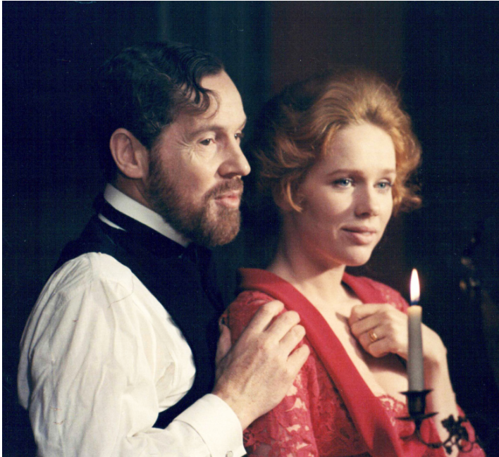
1972 CRIS ET CHUCHOTEMENTS (Viskningar och rop) d'Ingmar Bergman avec Liv Ullmann