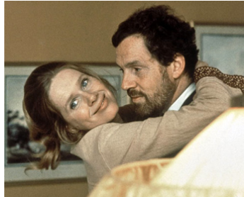
1973 SCÈNES DE LA VIE CONJUGALE (Scener ur ett äktenskap) d'I. Bergman avec Liv Ullmann