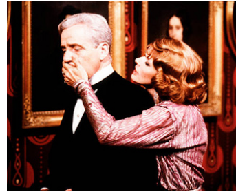
1986 LA DERNIÈRE MAZURKA (L'ultima Mazurka) de Gianfranco Bettetini avec Senta Berger