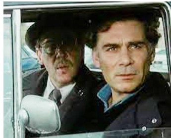
1976 UN JUGE EN DANGER (Io ho paura) de Damiano Damiani avec Gian-Maria Volonte