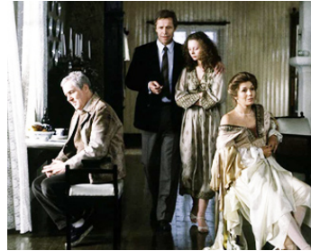
1985 LE SACRIFICE (Offret) d'Andrei Tarkovski avec Sven Wollter, Gudrun Gisladottir