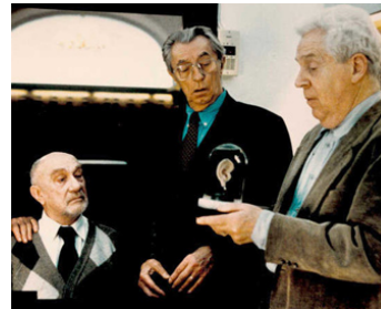
1994 THE SUNSET BOYS (Pakten) de Leiduluv Risan avec Robert Mitchum